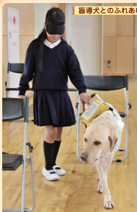
盲導犬とのふれあい